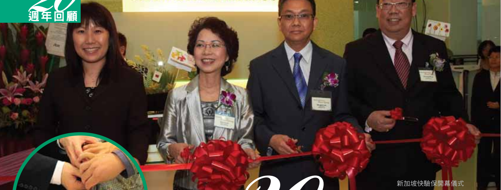
新加坡快驗保開幕儀式